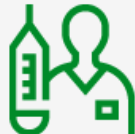
Yleislääkäri- kulu vakuutus