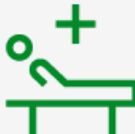
Hoitopäivä- kulu vakuutus