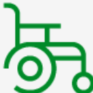
Tapaturmaisen haitan vakuutus